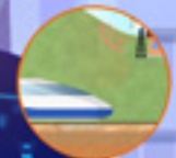
FRMCS Futuro sistema de comunicación móvil