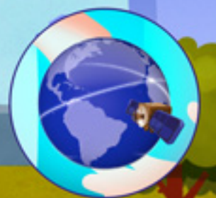
GALILEO Sistema posicionamiento por satélite