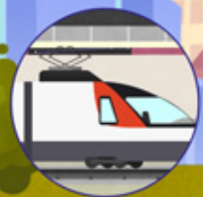
Conducción automática de trenes