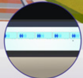
Nivel de ocupación en los coches