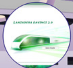
LANZADERA DAVINCI 2.0 Sistema avanzado gestión integrada tráfico Ferroviario