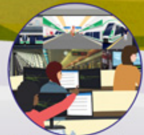
Nivel de ocupación en las estaciones