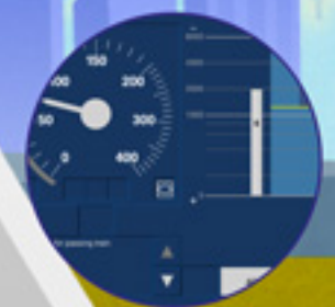
ERTMS Trenes por toda Europa