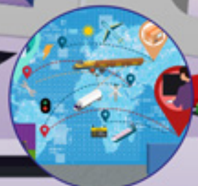
ÓPTIMA Plataforma ayuda gestión tráfico Ferroviario