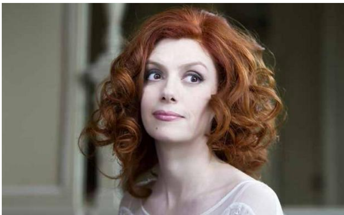
La soprano Patricia Petibón actúa hoy en Oviedo con La Cetra Barockorchester Basel.