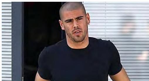
[Fotos] La Complicada Vida De Víctor Valdés, El Ex Portero Del... desafiomundial