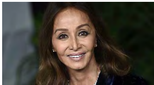
El antes y el después de las famosas con photoshop The Playlist