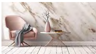
¡Ponte cómodo! #dreamhome Blog Inmobiliario Gilmar #dreamhome