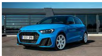
Nuevo Audi A1 Sportback, con hasta... Audi