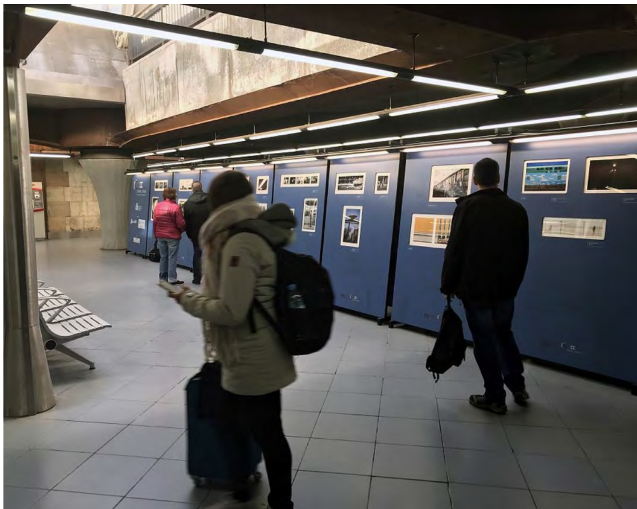
Grandes tableros y una pantalla son el soporte de las imágenes que componen la exposición