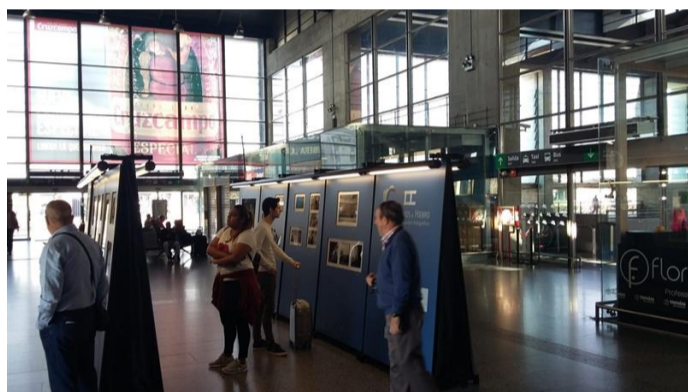
'Caminos De Hierro' En El Vestíbulo De La Estación De Córdoba