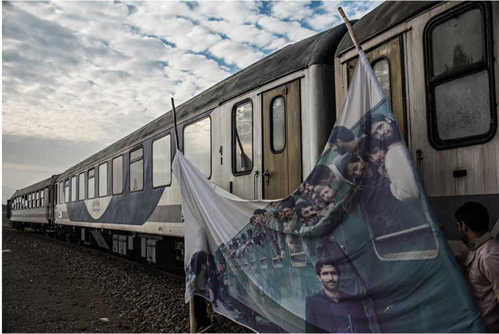
Premio Autor Joven

Aviso legal - Política de privacidad - Política de cookies