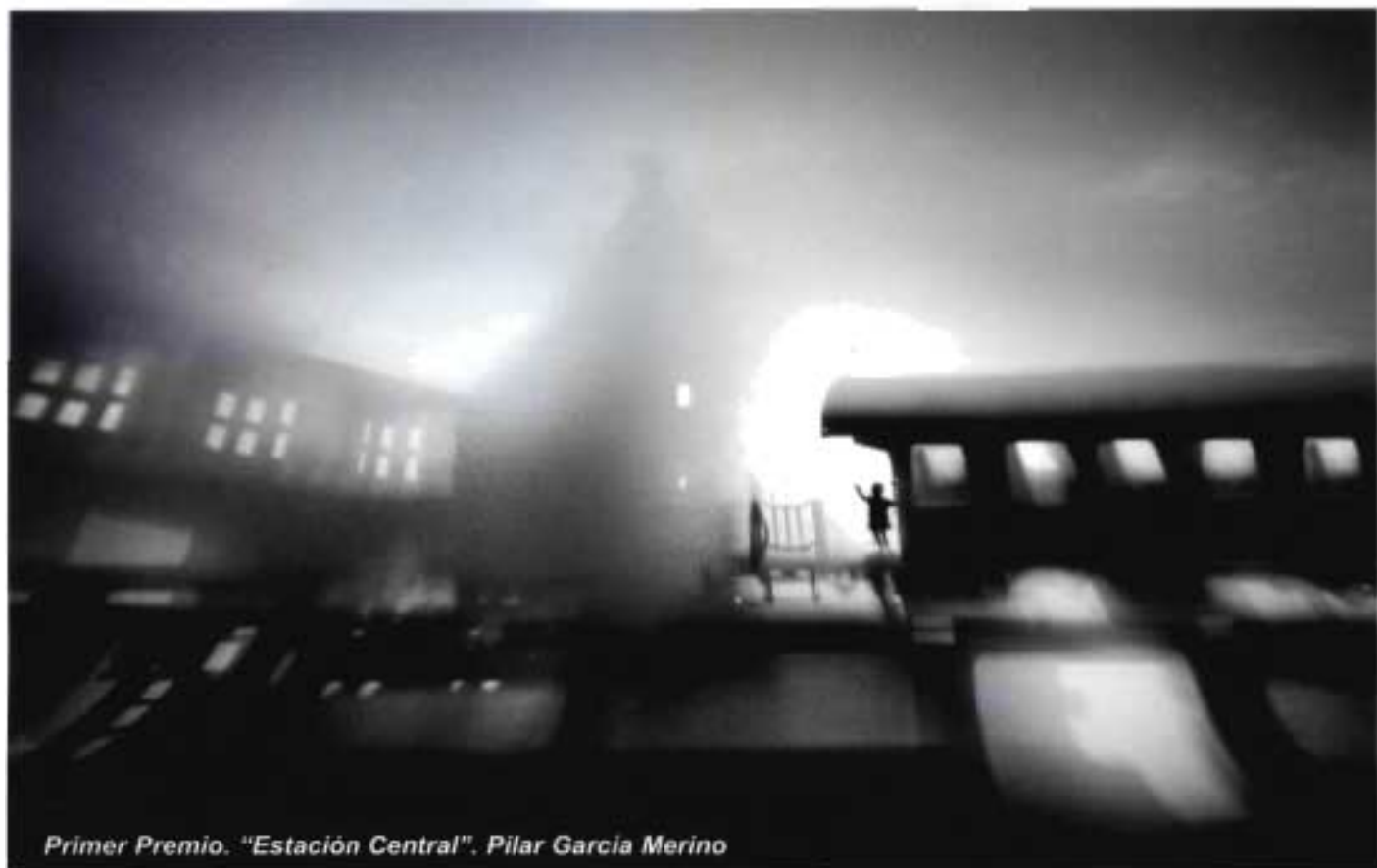
Primer Premio. "Estación Central". Pilar García Merino