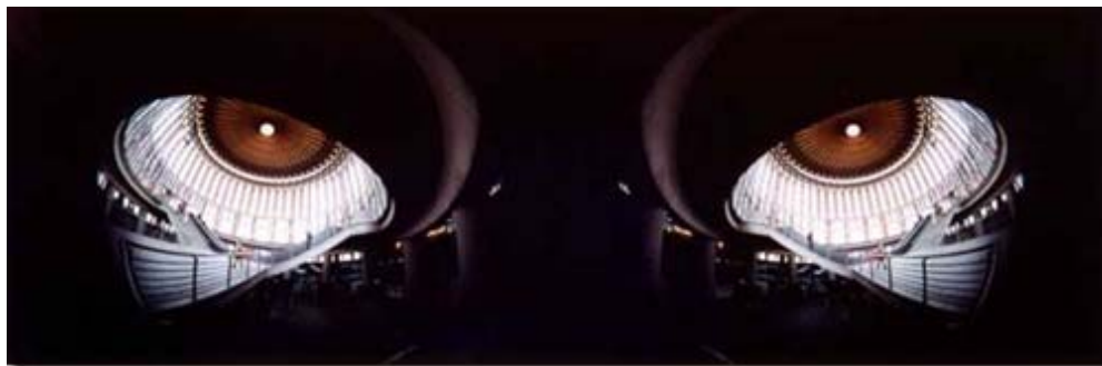
Fernando Martínez González y Colectivo Fotokissime · Gatocha · 2º Premio · 5º concurso fotográfico “Caminos de Hierro”