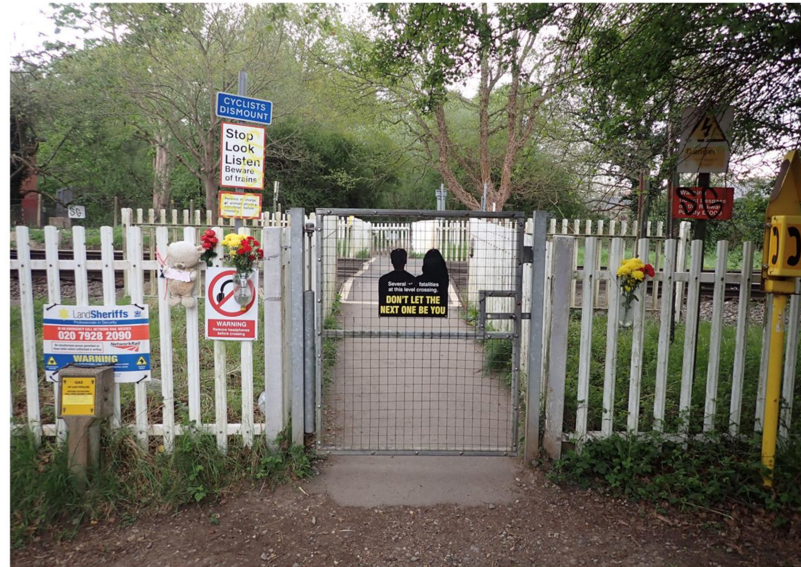
Figure 3: The entrance to Lady Howard crossing, approaching from Ashted Common (the direction of the pedestrian at the time of the accident).