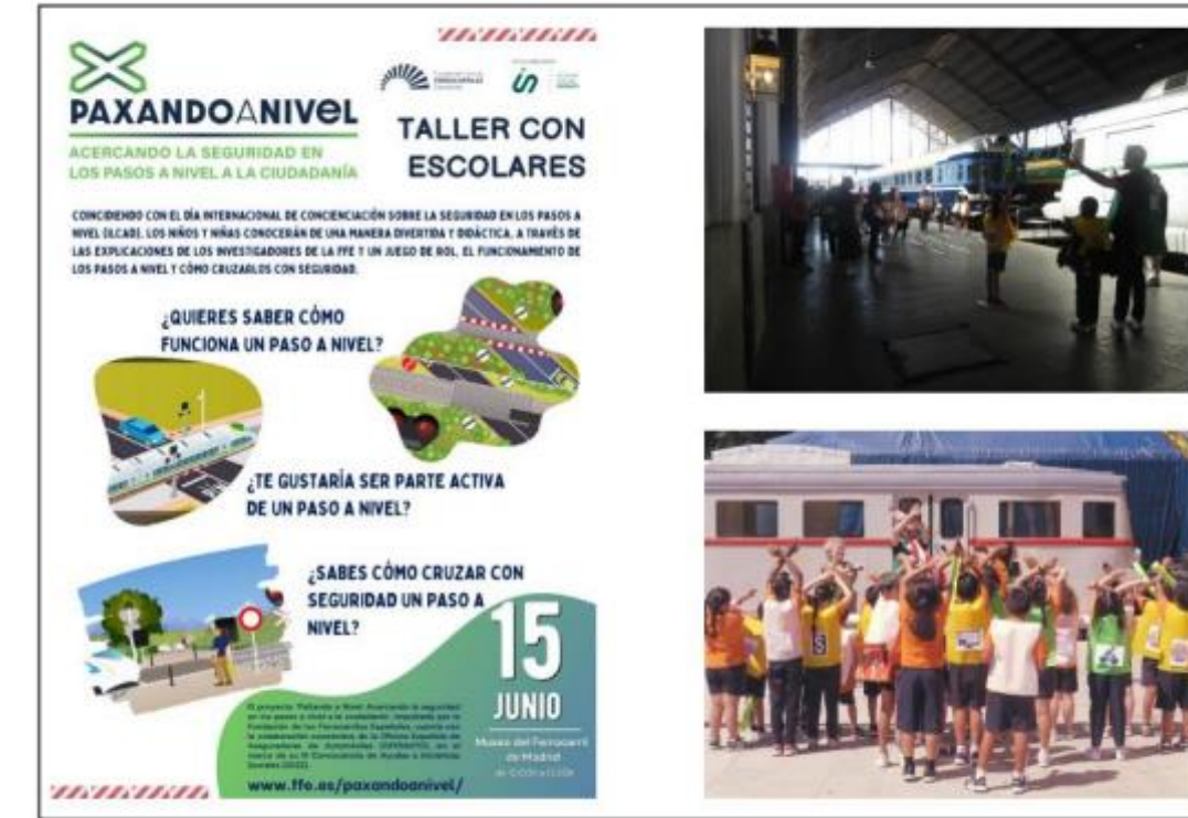
Visita y Taller "PaXando a Nivel"